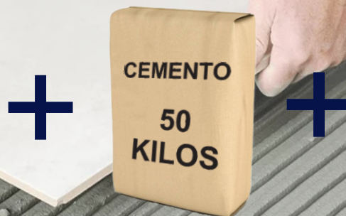
TABLA DE RENDIMIENTO